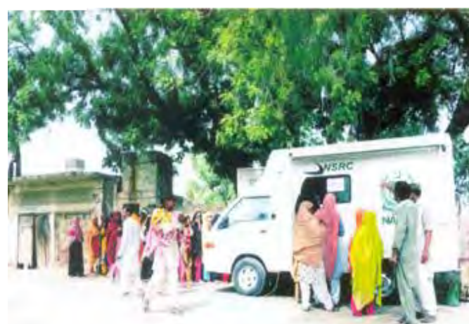
CNIC Registration in Vehari and Lodhran