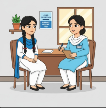
مقامی مددگار خدمات