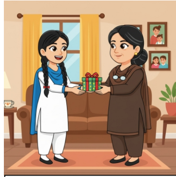
خالہ / پھوپھی