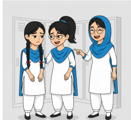
چھیڑنے پر ہنستا ہے