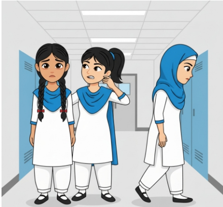
صورت حال کو نظر انداز کرتا ہے